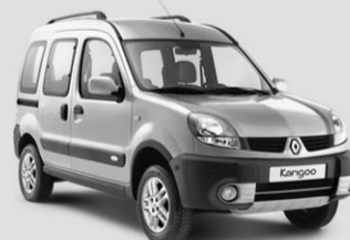
KANGOO PRIVILÈGE 1.6 16V Auch als 4 x 4 erhältlich

«Swiss Festival» Angebot*: Fr. 19 400.– Sie sparen Fr. 1 500.– und 5,9% Leasing