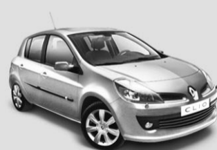
CLIO DYNAMIQUE TCE 100 (3-TÜRIG) Renault eco Auch 5-türig erhältlich