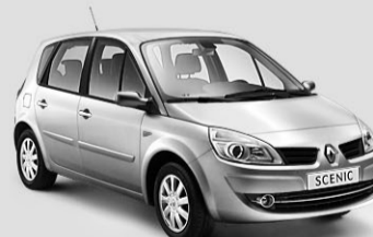
SCENIC DYNAMIQUE 2.0 16V Auch als Grand Scenic mit 5 oder 7 Plätzen erhältlich

«Swiss Festival» Angebot*: Fr. 19 900.– Sie sparen Fr. 3 800.– und 5,9% Leasing