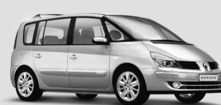
ESPACE DYNAMIQUE 2.0 TURBO

«Swiss Festival» Angebot*: Fr. 26 900.– Sie sparen Fr. 4 850.– und 5,9% Leasing